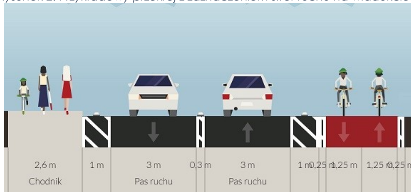
Rysunek 2. Przykładowy przekrój z zaznaczeniem stref ruchu na wiadukcie 5 .